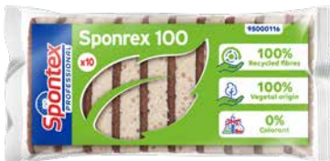
Sponrex 100 95000116