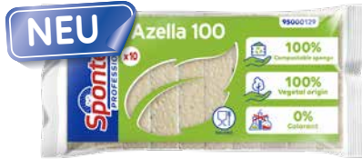
Azella 100 95000129