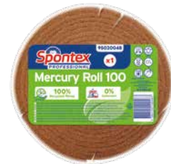
Mercury Roll 100 95020048

Zusammensetzung: Synthetische Recyclingfasern, abrasive Füllstoffe aus Aluminium und Walnusschale, Latex