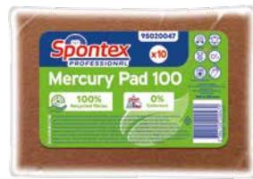
Mercury Pad 100 95020047

Zusammensetzung: Schwamm: Salze, Wasser, Zellulose. Scheuerteil: Synthetische Recyclingfasern, abrasive Füllstoffe aus Aluminium und Walnusschale, Latex